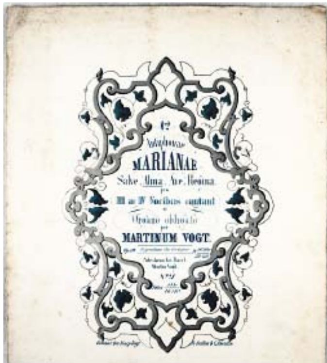
«Alma redemptoris mater» von Martin Vogt: Quelle (© Musikbibliothek Kloster Einsiedeln) und entsprechender RISM-Datenbankeintrag

Ob eine nächste CD produziert wird, ist auch eine finanzielle Frage. Die Mittel sind beschränkt. Der Verein finanziert